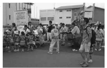
市民体育祭の様子