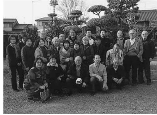
末広二丁目町会の皆さん

市内には、78地区の町会・自治会があり、それぞれの地域で、区長さんを中心に様々な活動を行っています。今回は、末広二丁目町会の「まち活動を紹介」します。