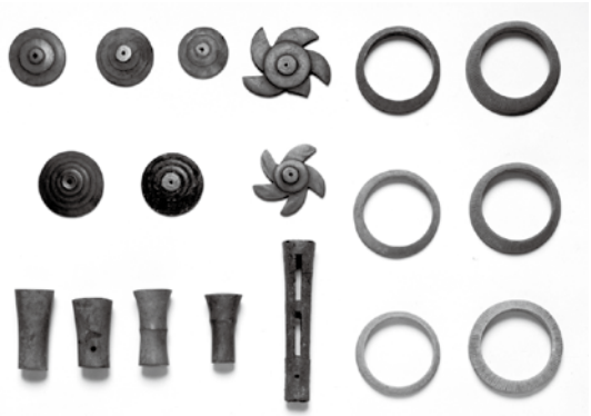
▲熊野神社古墳出土品

埼玉県を代表する前期古墳が造られました。熊野神社古墳です。熊野神社古墳は、江川の浸食谷に面した直径約38mの円墳で、その名前のとおり墳丘に熊野神社が建てられており、古墳自体は埼玉県の史跡に指定されています。昭和3年、地元で「オクマンサマ」と呼ばれていた熊野神社の社殿を改築する際、現在の社殿周辺から粘土が固められた主体部（埋葬施設）と考えられる遺構が発見され、この中から玉類や石製品および朱の塊など多くの遺物が出土しました。この遺構は粘土槨と呼ばれる棺を納めた施設で、出土した遺物は被葬者と一緒に埋葬された副葬品であったと考えられます。