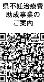
不妊治療費助成事業のご案内

特定不妊治療（体外受精・顕微授精）については、健康保険が適用されず高額なため、夫婦の合計所得が730万円未満（※2）の場合、県の助成制度があります。そのため、県の助成制度に上乗せする形で、市でも不妊治療費の助成を開始しました。 （※2）申請前年の合計所得。1月～5月の申請は前々年の合計所得。