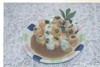
桶川市商工会長賞 ふるさと部門 「大根・人参・春菊の 酢味噌和え」 桶川市べに花ふるさと館 様