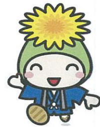
桶川市マスコット キャラクター 「オケちゃん」