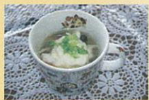
桶川市長賞 ふるさと部門 「野菜たっぷり山かけスープ」 菊池 美穂 様