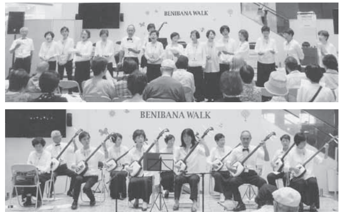
▲「津軽三味線を楽しむ会」の皆さん

現在は、桶川集会所と加納集会所を活動拠点に市内はもちろん市外の福祉施設にも慰問演奏にうかがっています。メンバーは、40代から80代の17人です。