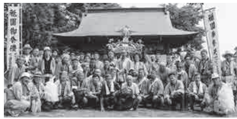
下日出谷東部自治会の皆さん

市内には78地区の町会・自治会があり、それぞれの地域で区長さんを中心に様々な活動を行っています。今回は、下日出谷東部自治会の「まち」活動を紹介します。