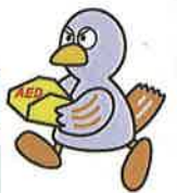
埼玉県のマスコット コバトン