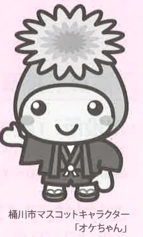
桶川市マスコットキャラクター「オケちゃん」