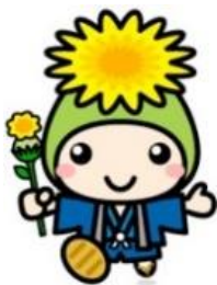
桶川市マスコットキャラクター オケちゃん