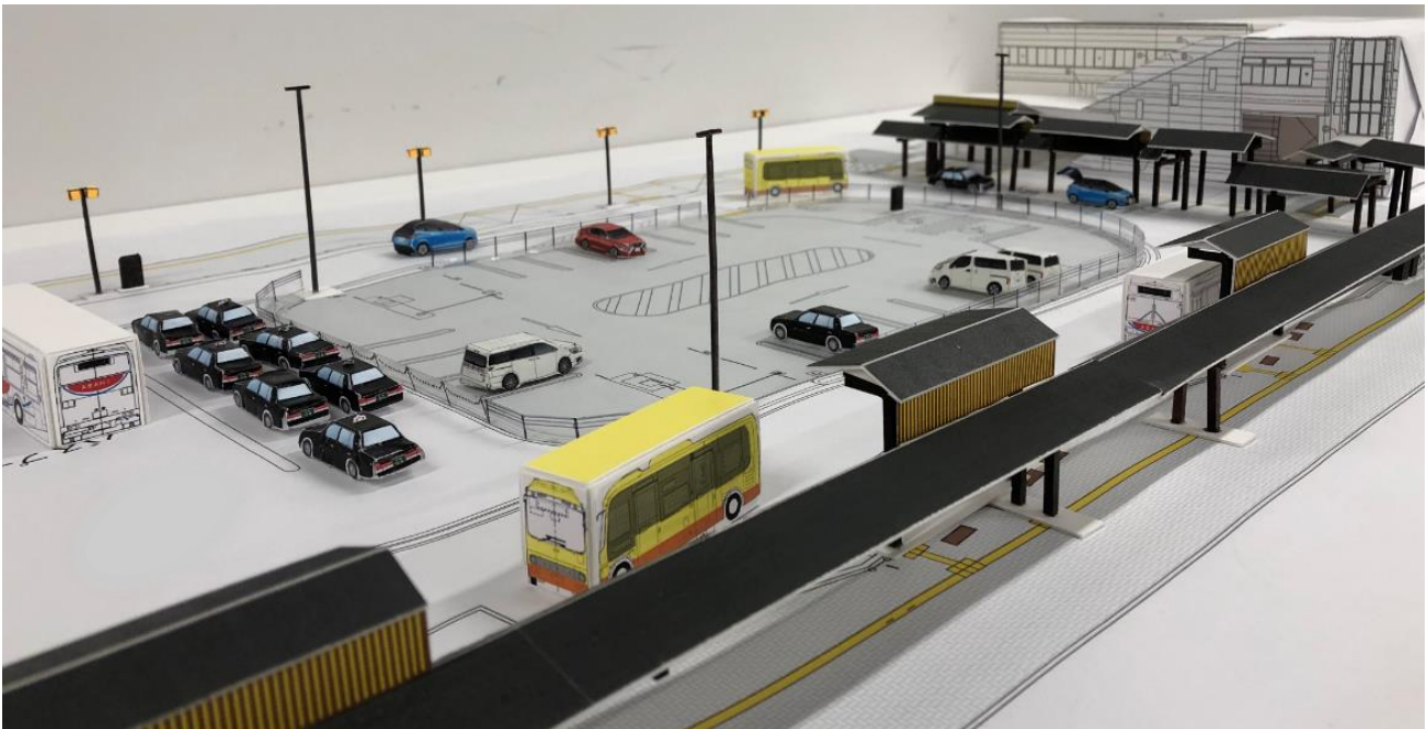
『南小跡地から駅前広場を臨む（1/100 ジオラマ）』

今後も引き続き、関係権利者様の御理解、御協力をいただきながら、事業進捗に取り組んでまいります。よろしくお願いいたします。