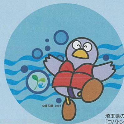
埼玉県のマスコット「コバタン」