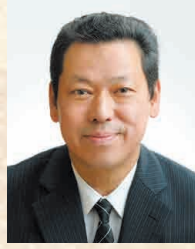
桶川市議会議員 岡安 政彦