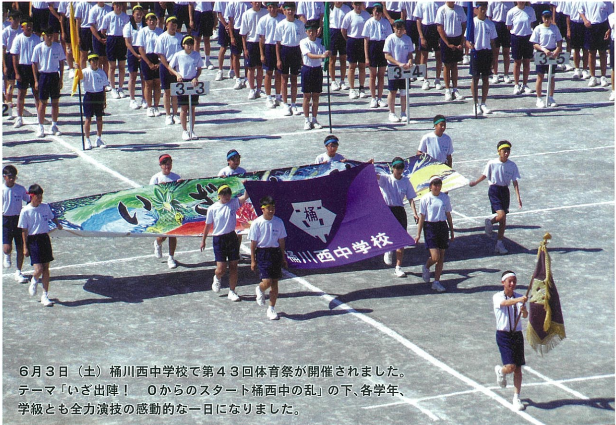
6月3日(土)桶川西中学校で第43回体育祭が開催されました。テーマ「いざ出陣! 0からのスタート桶西中の乱」の下、各学年、学級とも全力演技の感動的な一日になりました。