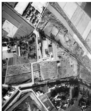
宮ノ脇遺跡周辺航空写真

桶川駅から東へ4kmほど行くと、高野戸川が赤堀川に合流する地点があり、両河川に挟まれた東側にのびる台地の先端に宮ノ脇遺跡があります。このような台地を舌状台地と呼びますが、川の水面との標高差が少なく低台地で、近年まで台地上には住宅地と畑が広がり、低地は水田となっていた地域でした。宮ノ脇遺跡では、縄文時代から中世までの集落や館などが確認されています。特に注目できるのは奈良時代の製鉄に関する遺構や遺物の発見でした。 埼玉県の古代製鉄遺跡は、大宮台地の東側と楠引台地から本庄台地を中心とした地域に多く分布しており、代表する遺跡としては伊奈町大山遺跡や深谷市(旧花園町)