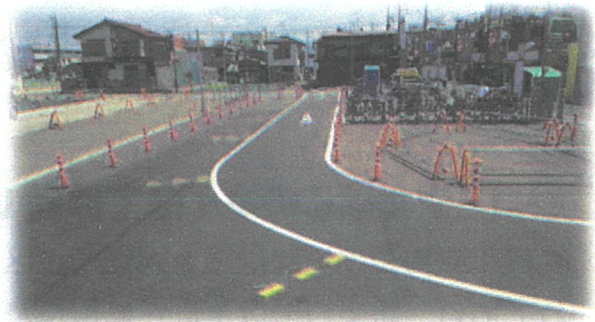
仮設桶川駅東口自動車送迎場

平成29年度も、さらなる事業の推進に向け、引き続き関係する権利者の皆さまに対するご相談を進めていきます。