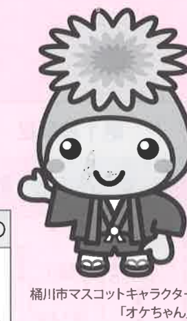
桶川市マスコットキャラクター「オケちゃん」