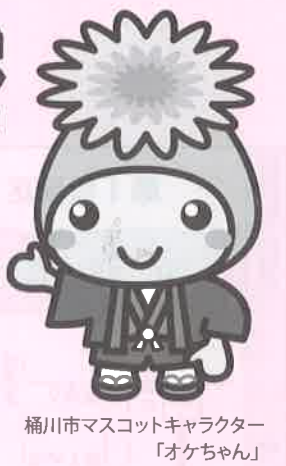
桶川市マスコットキャラクター「オケちゃん」