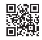
恋たまホームページ