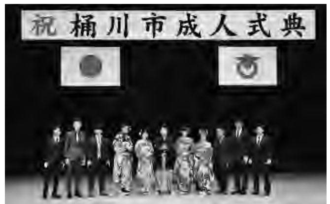
▲令和3年度成人式典写真

〒363-0014 桶川市神明2-2-10 TEL 048-775-4472 (Fax も同じ)