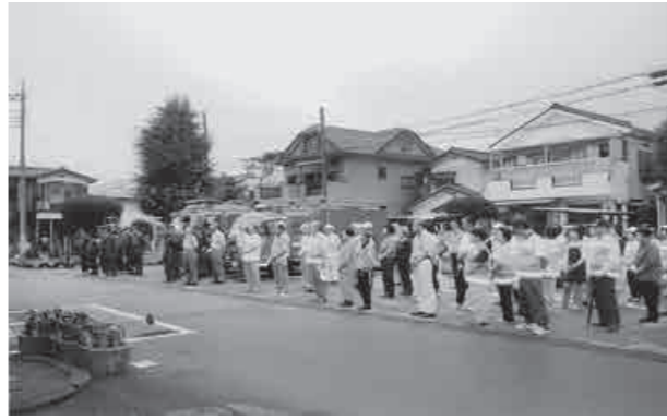
▲防災訓練開始前ミーティング

北一丁目は、南は稲荷通り、北は県道川越栗橋線で、中山道と国道17号に囲まれた地域です。古くは旧桶川町の若松町と言われた地域を含んでいます。