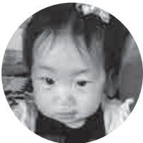
渡邊 莉心ちゃん(下日出谷西) 莉心、1歳のお誕生日おめでとう！おてんばで怪我が心配だけど元気にすくすく大きくなってね。だーいすき♡