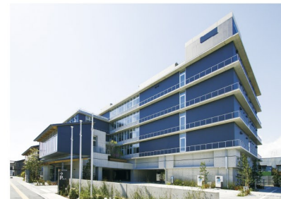
●桶川市役所 新庁舎外観 最寄りバス停 西34