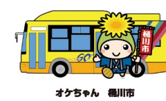
オケちゃん 桶川市