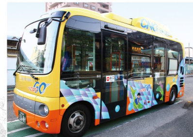
●東循環・東西循環専用 小型CNGノンステップバス