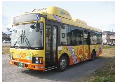
●西循環専用 中型CNGノンステップバス 西循環ルートのみスイカ・バスモ等の ICカードが利用できます。