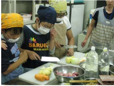
みんなで食事の準備