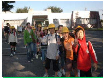
学校へ行ってきます！