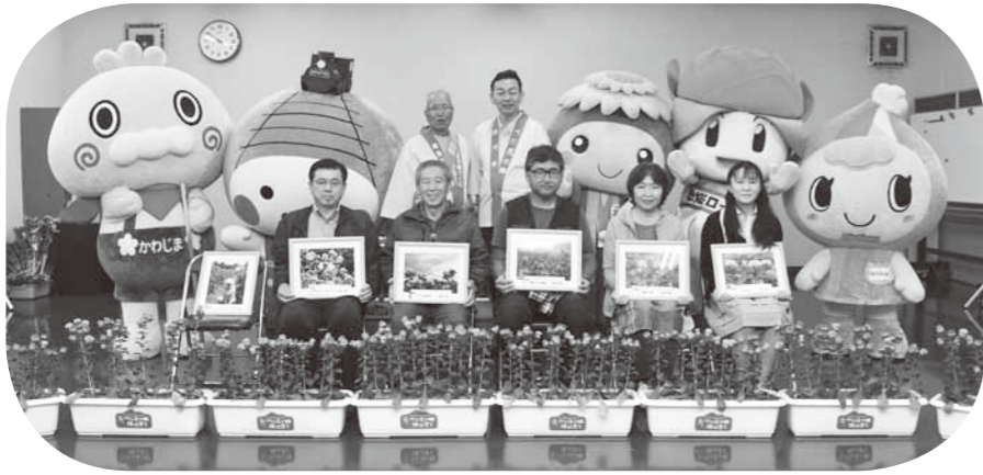
▲べに花写真コンテスト表彰式

農業センター周辺をメイン会場に「べに花まつり」が開催されました。初日はあいにくの天気でしたが、翌日は晴天に恵まれ、多くの来場者で賑わいをみせました。(6月15日・16日)