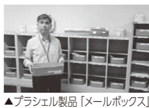
▲プラシエル製品「メールボックス」

開発した「プラシエル」は、産業廃棄物となる卵の殻を60%以上配合したバイオマスプラスチック(※1)です。「プラシエル」は、通常のプラスチックの加工と同じ設備で作ることができると、新たな設備投資の必要がありません。また、通常のプ