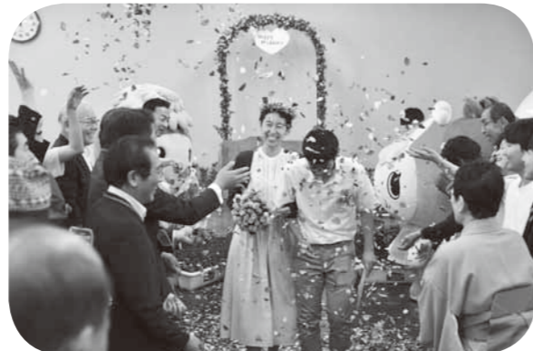
▲べに花煙で結婚式