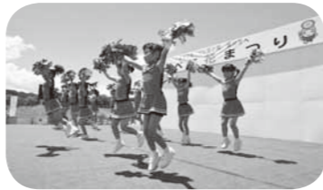
▲ステージイベント