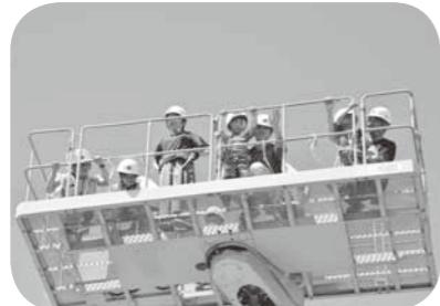
▲高所作業車乗車体験