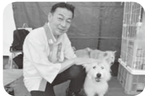
▲ワンちゃん譲渡会