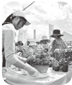
▶ガーデニング教室