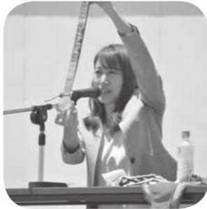
▶オリンピックメダリスト講演会 (藤丸真世さん)