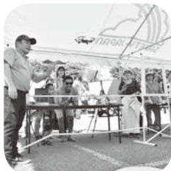
▲トイ・ドローン体験