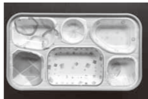
▲プラシエル製品「トレイ」

ラスチックと同程度の価格で製造・販売できるメリットがあります。すでに「プラシエル」製品は、皆さんの身近にあつて、外食チェーン店のトレイや箸、大手保険会社のノベルティグッズなどに使われています。