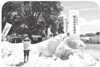
▲おけがわ雪山大作戦