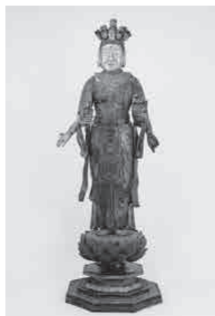
▲木造十一面観音立像

最近、この泉福寺にほど近い川田谷の新御堂という小堂に伝来した本尊の木造十一面観音立像と両脇侍の木造不動・毘沙門天像が、優れた仏像彫刻と評価され市の文化財に指定されました。