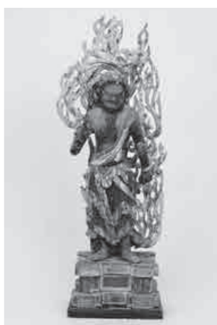
▲木造不動明王立像

の相を表した動感あふれる姿に、写実的で生彩感のある鎌倉彫刻の特色がよく見える佳品です。制作時代は鎌倉末頃、銘に「応円」という仏師名が確認されたことから、鎌倉仏師の造立と考えられます。