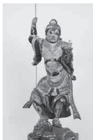
▲木造毘沙門天立像

仏像の拝観は事前に許可を得るなど手続きが難しいですが、新御堂像は仏像の保護のため現在市の歴史民俗資料館に寄託中ですので、企画展等の機会をみて拝観されてはいかがでしょうか。