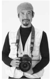
講師 渡部陽一 さん (戦場カメラマン)

8月は「人権尊重社会をめざす県民運動強調月間」です。 とき ▼ 8月24日(土)午後1時～3時30分 ところ ▼ 朝霞市民会館ゆめばれす 内容 ▼ ①人権講演会