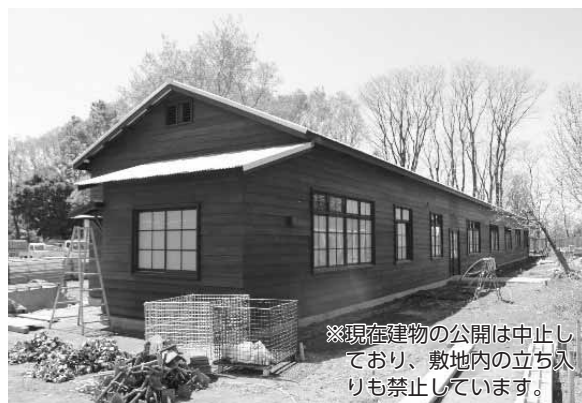
▲工事中の兵舎棟の写真