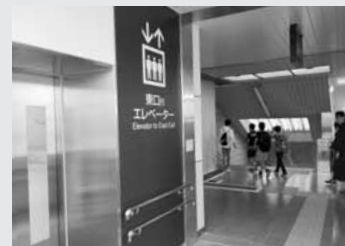
▲設置されたエレベーター

去る7月14日(日)、駅東口エレベーターが供用開始となり、竣工式が行われました。