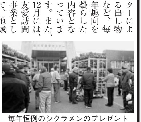
毎年恒例のシクラメンのプレゼント

Q. 活動内容は? 年間を通じた様々な事業を展開しています。4月には川田谷小学校の入学児童を対象にお祝い事業として、図書カードを配布しています。 また、高齢者の皆様方を対象とした事業として、県立桶川西高校の西峯会館を会場に、高齢者感謝の集いを9月に開催しています。こちらは、西中学校の吹奏楽部の演奏や地元有志による伝統芸能披露、歌手を招いてのコンサート、いずみの家や地域包括支援セン