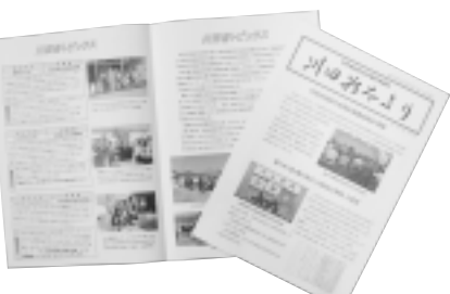
身近な話題をお届けする『川田谷たより』

年から地域の身近な話題を掲載することにして、掲載するネタ探しが大変です。また、川田谷地区は、地域のつながりがしっかりしていて、地区社協の活動を展開するうえでも、非常に心強く感じています。 Q. 今後の目標は? 以前行った研修会で旧吹上町と寄居町の高齢者見守りネットワーク活動について学びました。行政(区長)と民児協(民生委員・児童委員)と福祉委員の三者が一丸となって地域の高齢者を見守る体制やシステムを構築したとのこと。川田谷地区社協にとっても大いに参考になる事例ですので、川田谷でも行政・民児協・ボランティアの連携を強化し、横断的な活動を展開していきたいと考えています。 問合せ 桶川市社会福祉協議会 728-2221