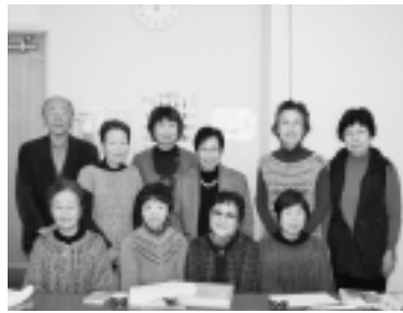
傾聴・家庭看護の会の皆さん

第5回「傾聴・家庭看護の会」 市内でボランティア活動をされているグループをインタビュー形式で紹介します。第5回は、「傾聴・家庭看護の会」の皆さんにお話を伺いました。