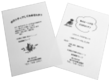
メンバー確保のためのチラシ

「春のふれあいフェスタ」や「ボランティア見本市」では、会の宣伝も行い、メンバーの確保に取り組んでいます。お話をしただけの時間は、利用者だけでなく、私たちにとっても楽しい時間となりますので、多くの方に参加いただければと思います。 「春のふれあいフェスタ」や「ボランティア見本市」では、会の宣伝も行い、メンバーの確保に取り組んでいます。お話をしただけの時間は、利用者だけでなく、私たちにとっても楽しい時間となりますので、多くの方に参加いただければと思います。