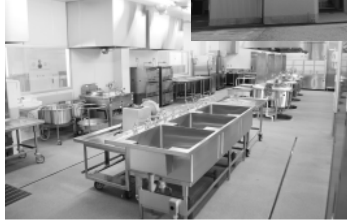
▲川田谷小給食室整備事業

平 成25年度一般会計は、予算現額222億5,611万9千円に對して、収入済額は、203億6,817万6千円(収入率90.3%)です。 収入済額の多いものとして、市税、国庫支出金、市債、地方交付税があげられます。支出済額は、196億978万7千円(執行率86.9%)で、民生費、総務費、土木費が多くなっています。 また、国民健康保険、公共下水道事業など四つの特別会計の予算現額合計は、150億5,617万1千円ですが、収入済額は、138億6,014万2千円(収入率92.1%)、支出済額は、133億8,108万3千円(執行率92.2%)となっています。