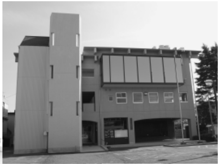
▶総合福祉センター耐震改修事業

財政状況の公表に関する条例に基づき、平成25年10月1日から平成26年3月31日までの予算執行状況と、3月末現在の累計をお知らせします。 会計年度は3月31日で終わりますが、5月31日までは出納整理期間として収入、支出がありますので、平成25年度決算とは異なります。平成25年度の決算については、12月号でお知らせします。