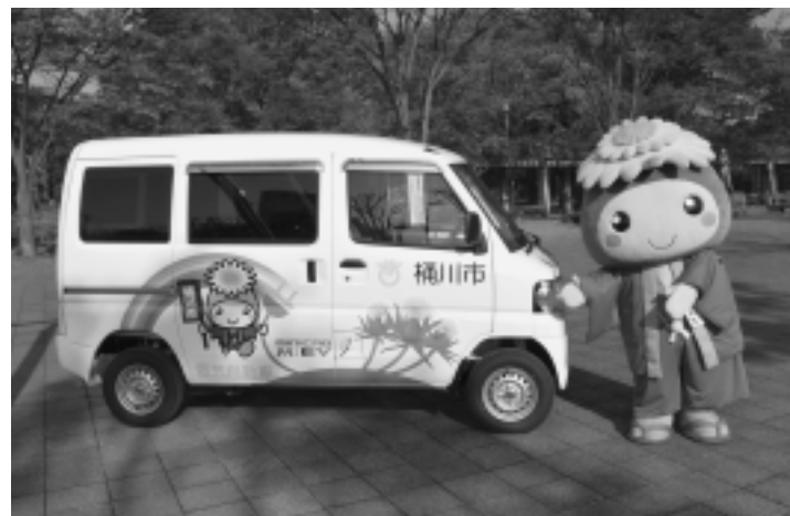
▲電気自動車購入事業

平 成25年度一般会計は、予算現額222億5,611万9千円に對して、収入済額は、203億6,817万6千円(収入率90.3%)です。 収入済額の多いものとして、市税、国庫支出金、市債、地方交付税があげられます。支出済額は、196億978万7千円(執行率86.9%)で、民生費、総務費、土木費が多くなっています。 また、国民健康保険、公共下水道事業など四つの特別会計の予算現額合計は、150億5,617万1千円ですが、収入済額は、138億6,014万2千円(収入率92.1%)、支出済額は、133億8,108万3千円(執行率92.2%)となっています。