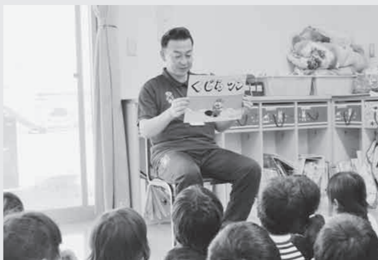
「散歩・鬼ごっこ・紙芝居・給食の時間を子どもたちと一緒に過ごしました」

10月30日、日出谷保育所で「保育士体験」をしました。これまで家事育児の多くを妻に任せてきた私にとっては、子どもたちとどう向き合ったらよいのか大変不安でしたが、所長の案内で教室に入ると、すぐに元気いっぱいの子もたちが笑顔で「ワー」と駆け寄ってきた瞬間、その不安はあっという間にふき飛びました。