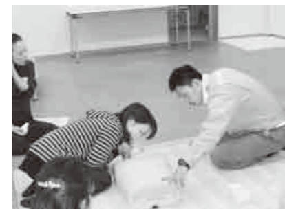
救急救命講習の様子