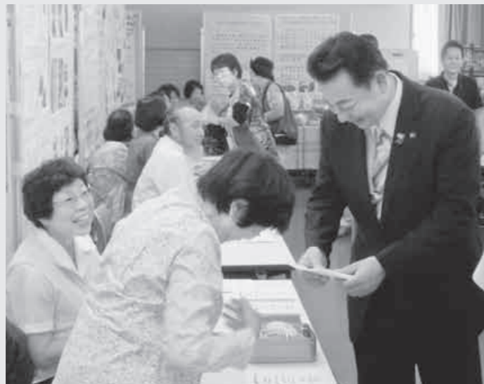
【会場は多くの参加者で盛り上がりました】

去る9月29日、「おけがわボランティア・市民活動見本市」が地域福祉活動センターで開催され、当日20を超えるボランティア団体が参加し、それぞれの活動紹介や体験教室、ステージ発表などが行われました。この見本市は、「おけがわボランティア・市民活動ネットワーク」が主体となって開催し、各団体の活動を紹介したり、参加した団体同士が交流を図ることにより、新たな活動の広がりが期待されるイベントです。