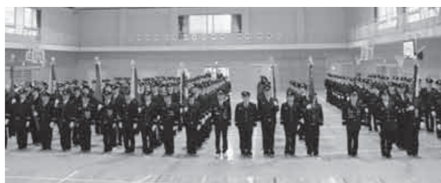
平成24年度 特別点検

特別点検は、服装規律点検・機械器具点検・放水訓練などを行うもので、桶川小学校校庭(雨天の場合、体育館)で午前8時から実施されます。