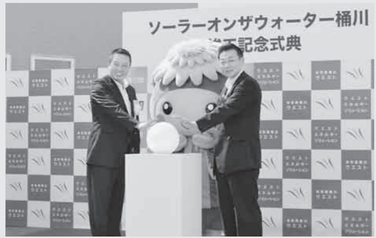
「ソーラーオンザウォーター桶川」竣工式典

埼玉県国民健康保険団体連合会が行っている保養施設宿泊利用共同事業の指定を受けた保養施設(国内の約300か所の旅館、ホテルなど)を利用する場合、次のとおり補助をして