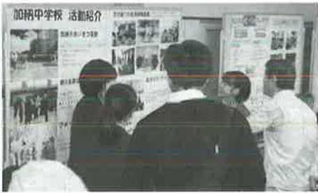
(↑加納中学生による活動説明)

10月21日(日) 10時～15時 場所 地域福祉活動センター(末広2-8-8)