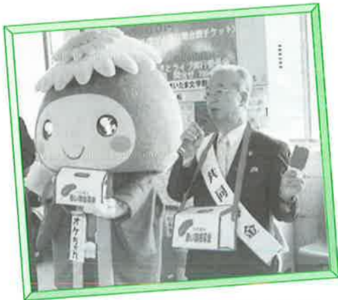
（募金を呼びかける岩崎支会長）