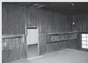
兵舎棟の内部の様子

記名会の開催 ▶11月中旬を予定しています。詳細は、寄附をいただいた人にお送りするご案内通知を確認してください。