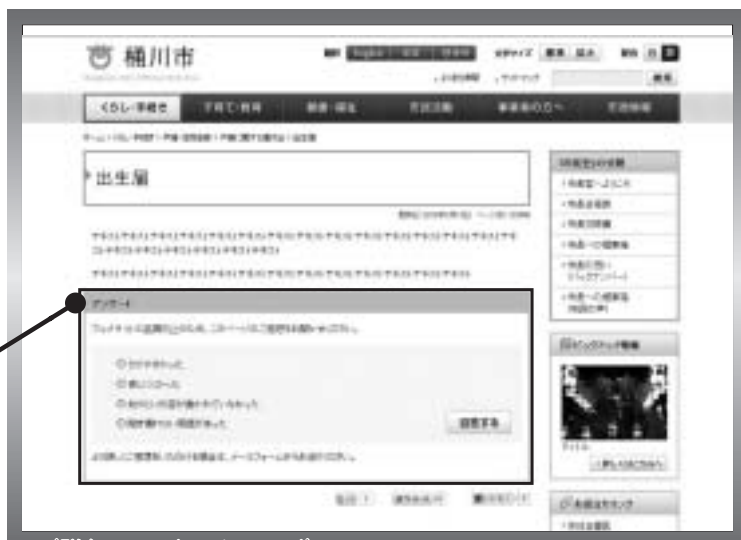
▲（詳細ページのイメージ）

各ページに簡易アンケートを配置しました。皆様の分かりにくい、探しにくいなどの声が届きやすくなり、ページの改善につながります。