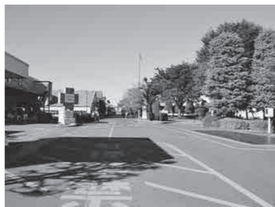
▲緑の多い広大な敷地

敷地面積は約27万㎡です。敷地の中には、複数の関係会社及び協力会社も入っており、全体で約700人が働いています。お客様のニーズにお応えできるよう、専門の設備や技術者を確保するとともに、品質および環境マネジメントシステムISO9001、14001の認証や航空機部品に特化したNadcapの認証を取得・維持しています。