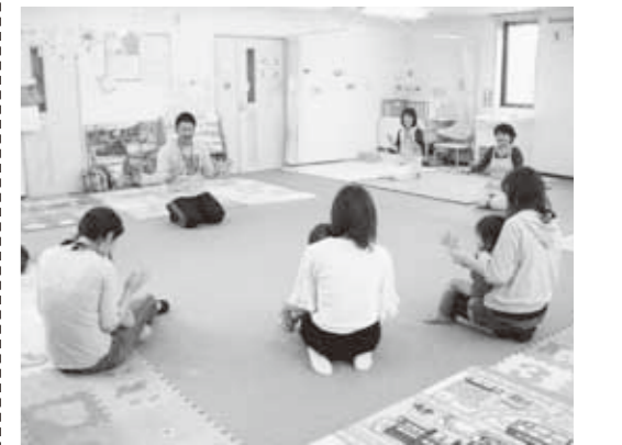
はっぴいひろば☆の様子

☆はっぴいひろば☆親子でお友達をつくりませんか?! とき ▶ 5月16日(水)午前10時～正午 ところ ▶ 子育て支援センター 内容 ▶ 手あそび、うた、紙芝居、情報交換など 対象 ▶ 市内在住の引越してきたばかりのお子さんと保護者10組【先着順】 費用 ▶ 無料 申込み ▶ 子育て支援センターへ。