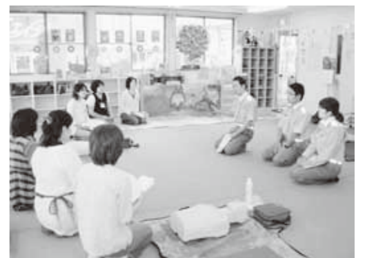
子育て支援講習会の様子

し出ください。【定員10人】 申込み ▶ 電話で5月25日(金)までに子育て支援センターへ。