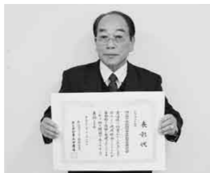
桶川西小学校地域安全防犯推進委員会さん