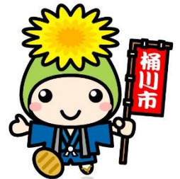
埼玉県けんこう大使 「オケちゃん」