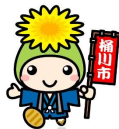
埼玉県けんこう大使