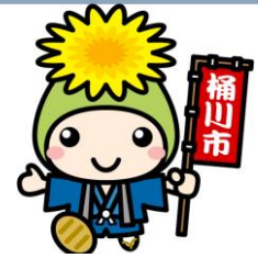
埼玉県けんこう大使 「オケちゃん」