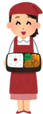
配食サービス 登録事業者