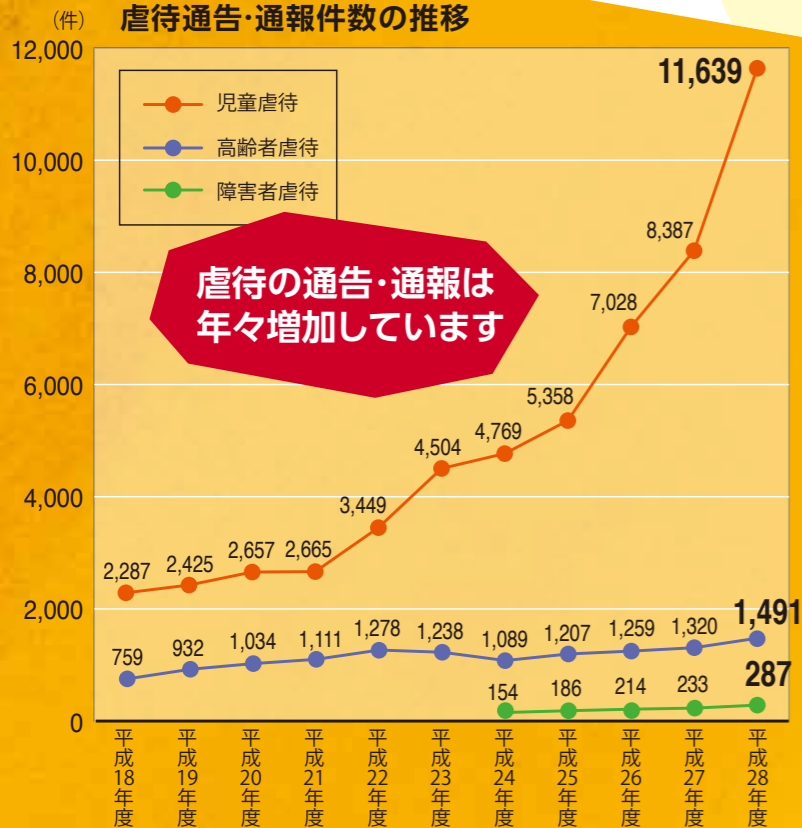
埼玉県の虐待通告・通報件数の推移