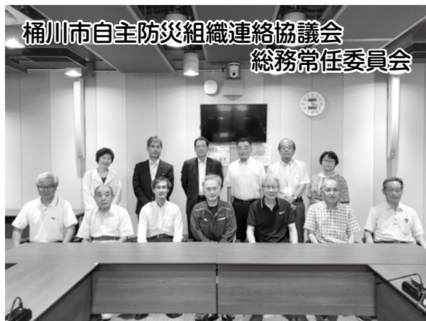
桶川市自主防災組織連絡協議会 総務常任委員会 自主防災組織での防災対策の取組状況や課題 (6/29)

市議会の常任委員会では、それぞれの所管事務に関する市内の団体と、意見交換会を実施しましたので、ご紹介します。