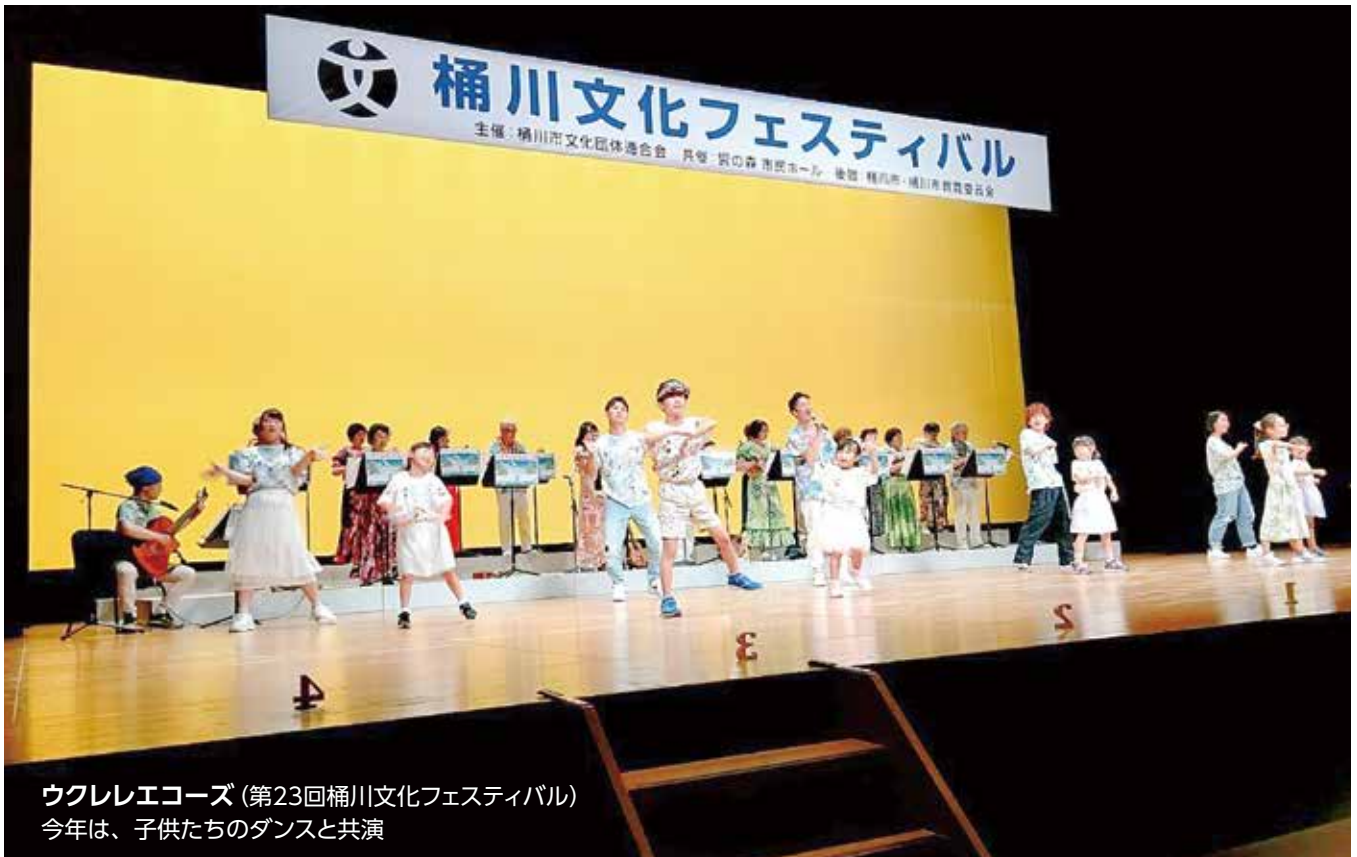
ウクレレエコーズ (第23回桶川文化フェスティバル) 今年は、子供たちのダンスと共演