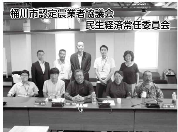
桶川市認定農業者協議会 民生経済常任委員会 桶川市認定農業者協議会の現状と課題等について (6/28)