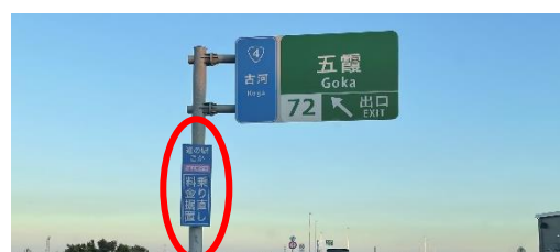
道路案内標識例（高速道路）