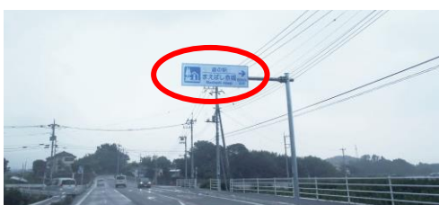
道路案内標識例（一般道）

なお、道の駅の名称につきましては、施設内の看板等だけでなく、圏央道や上尾道路、県道川越栗橋線などの道路案内標識などにも表示される予定です。