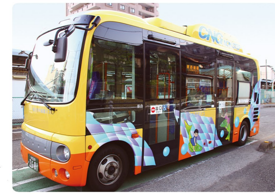
●小型ノンステップバス ※デザインは変更する場合があります。 西12 西20 西21 西30 東10 東20 東30 東40

桶川市民生活部安心安全課 TEL 048(786)3211(代) 令和3年4月発行