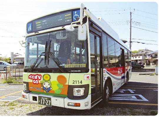
●中型ノンステップバス ※デザインは変更する場合があります。 西10 西11 スイカ・バスモ等のICカードがご利用できます。