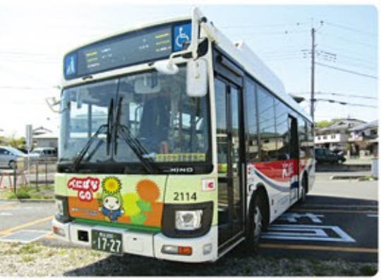
●中型ノンステップバス ※デザインは変更する場合があります。 西10 西11 スイカ・バスモ等のICカードがご利用できます。