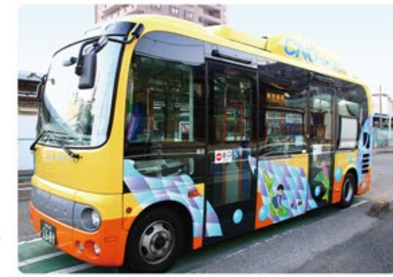
●小型ノンステップバス ※デザインは変更する場合があります。 西10 西20 西21 西30 東10 東20 東30 東40