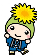
桶川市マスコットキャラクター オケちゃん

桶川飛行学校平和祈念館では、平和に対する思いや考えを深めていただく機会を増やすため、スタンプラリーや夜間のライトアップなど様々なイベントを開催します。いつもと違った雰囲気平和祈念館が楽しめます。