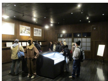
館内ガイドツアー