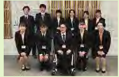
令和4年度新規採用職員

その他▶詳細は市ホームページ、または市役所情報コーナー、職員課で配布の受験案内を参照してください。