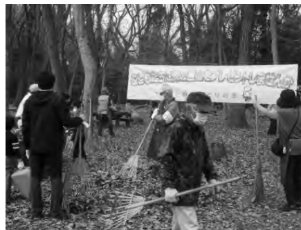
川田谷こどもの森で開催された「探検！発見！雑木林！ヤマで遊んでみよう」でのヤマかきの様子（3月13日）