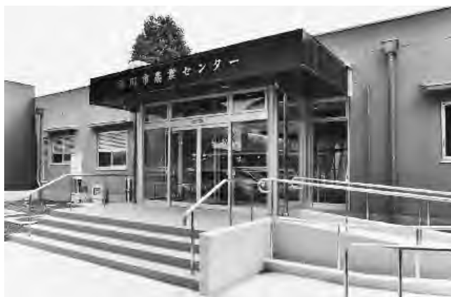
▲農業センターがリニューアル