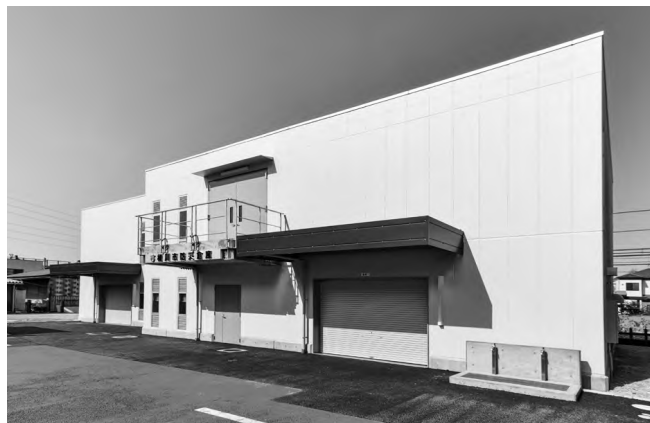
▲備蓄用防災倉庫が完成

また、国民健康保険、公共下水道事業など一般会計を除く会計の予算現額合計は、159億2,447万7千円ですが、収入済額は、146億3,467万5千円（収入率91・9％）、支出済額は、146億2,943万3千円（執行率91・9％）となっています。