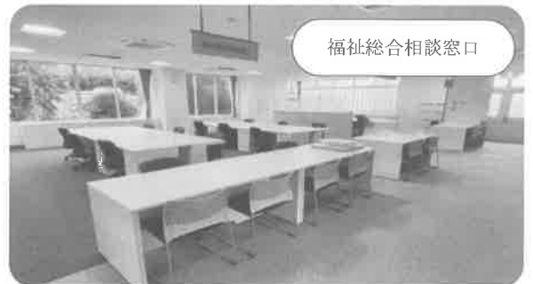
福祉総合相談窓口