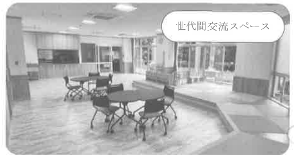
世代間交流スペース