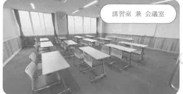
講習室 兼 会議室